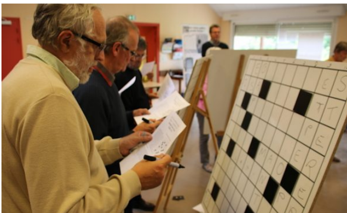
Vue du tournoi de 2017

La seconde édition du festival « Les Cruciverbistes en Seine » aura lieu à Poses (Eure), les 1er et 2 septembre 2018. Porté par le courant du succès de 2017, l'événement réalisé par l'auteur d'Eskimos pour l'association « les Amis de l'église Saint-Quentin », va reconduire « la formule qui