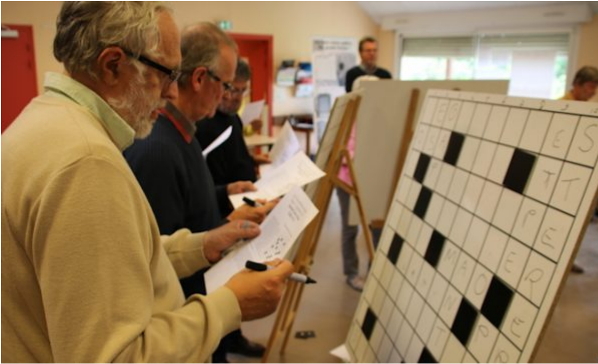
Vue du tournoi de 2017

La seconde édition du festival « Les Cruciverbistes en Seine » aura lieu à Poses (Eure), les 1er et 2 septembre 2018. Porté par le courant du succès de 2017, l'événement réalisé par l'auteur d'Eskimos pour l'association « les Amis de l'église Saint-Quentin », va reconduire « la formule qui gagne » testée l'an passé.