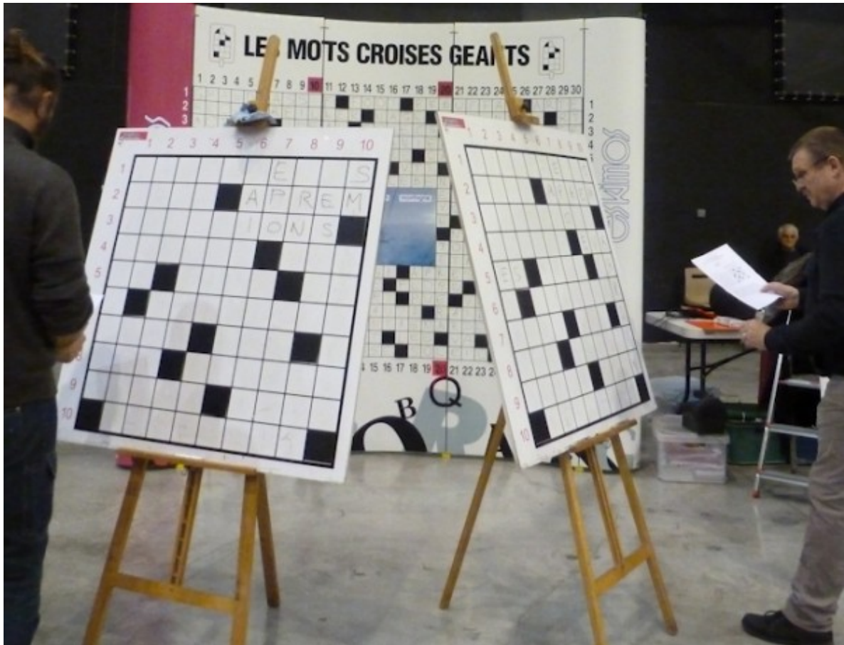
Sur le stand Eskimos, le match du dimanche : Jean-Baptiste Mignot contre Xavier Chevalier.

J.R. a réussi son entrée dans Troyes les 9, 10 et 11 décembre 2016. Bien placés à la porte du Cube, la salle de spectacle de la cité auboise transformée en bastion des jeux vidéo, ses rencontres de mots croisés ont su capturer et captiver le public de passage. Et montrer leurs différentes facettes. D'un côté, les cruciverbistes réunis ont pu résoudre plusieurs grilles géantes (une par jour) extraites des classiques de l'auteur ainsi que des œuvres de 100 cases – pour toutes les générations – présentées sur des chevalets. De l'autre, les champions ont pu disputer sur le stand des matchs de démonstration : Sylvie Gony contre Cyrille Veltz, sous l'oeil des caméras de cinéastes, le samedi ; Jean-Baptiste Mignot contre Xavier Chevalier le dimanche. Sujet tout trouvé de la grille de démo : « La guerre de Troyes » (remportée respectivement par la concurrente côte-d'orientale et le cruciverbiste ardennais).