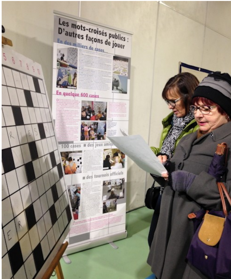
Le public au tableau

Les hôtes d'Objectif-Tibet (O.T.) ont croisé les mots le 5 novembre 2016 au Centre d'animation de Sciez (Haute-Savoie). Pour les 20 ans de l'association locale, défendant la cause de l'ancien État himalayen, le public a pu résoudre ensemble plusieurs grilles de 100 cases conçues par l'artiste-verbicruciste du pays* et présentées sur des tableaux tenus par des chevalets.