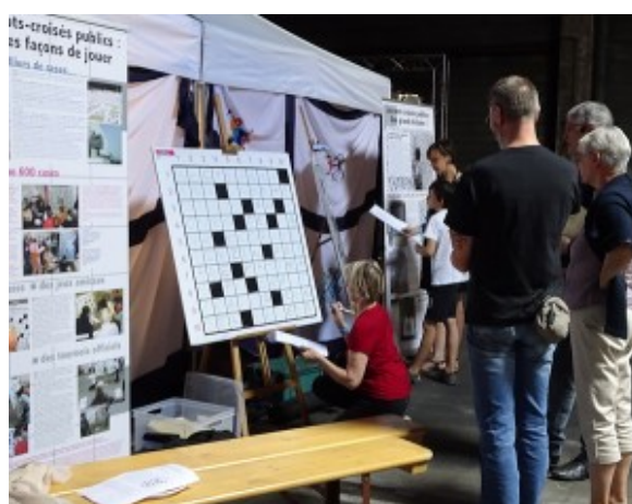
Au festival des Himalaya en septembre

Après son expédition « himalayenne » à Schiltigheim à la mi-septembre, JR. enchaîne ce 5 novembre à Sciez, en Haute-Savoie.