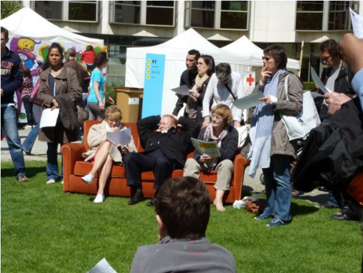
Le public courbevoisien lors d'une séance de résolution, au parc des Pléiades, en 2012

Après avoir manqué l'édition de 2013 à cause d'une coïncidence de calendrier, J.R. est réinvité au Festival des mots libres de Courbevoie, ces samedi 21 et dimanche 22 juin. Au parc des Pléiades, où il était apparu pour la première fois en 2010, l'auteur d'Eskimos et créateur des rencontres publiques de mots croisés va animer matins et après-midis des résolutions collectives de grilles de 600 et 100 cases pour tous les publics. L'un des clous du week-end sera la première résolution publique d'une énigme géante inédite autour de Louis de Funés, natif de la ville en 1914, il y a 100 ans de cela. Samedi comme dimanche, les séances de mots croisés collectifs sont ainsi programmées : grille géante à 11 h et 15 h 30, grilles de 100 cases à 17 h 30. Le verbicruciste carrozien mettra également à disposition en continu, nombre de ses grilles sur papier, dans l'alcôve de l'ancienne mairie.